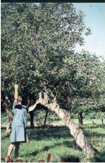
Vieux Damas à tronc torsadé.