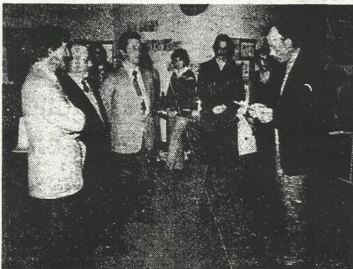
Une intéressante exposition...