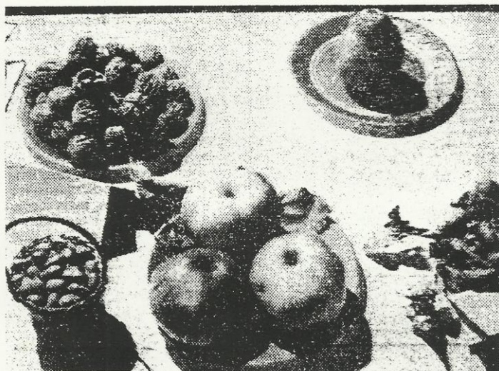
... et surtout de beaux fruits !