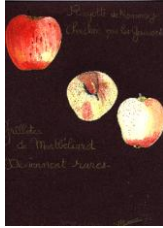
© choisel jl. 1980 Rayotte de Nommay et Grillote de Montbéliard huile.

Et tout cela odore la salle de mille parfums de fleurs et de fruits.