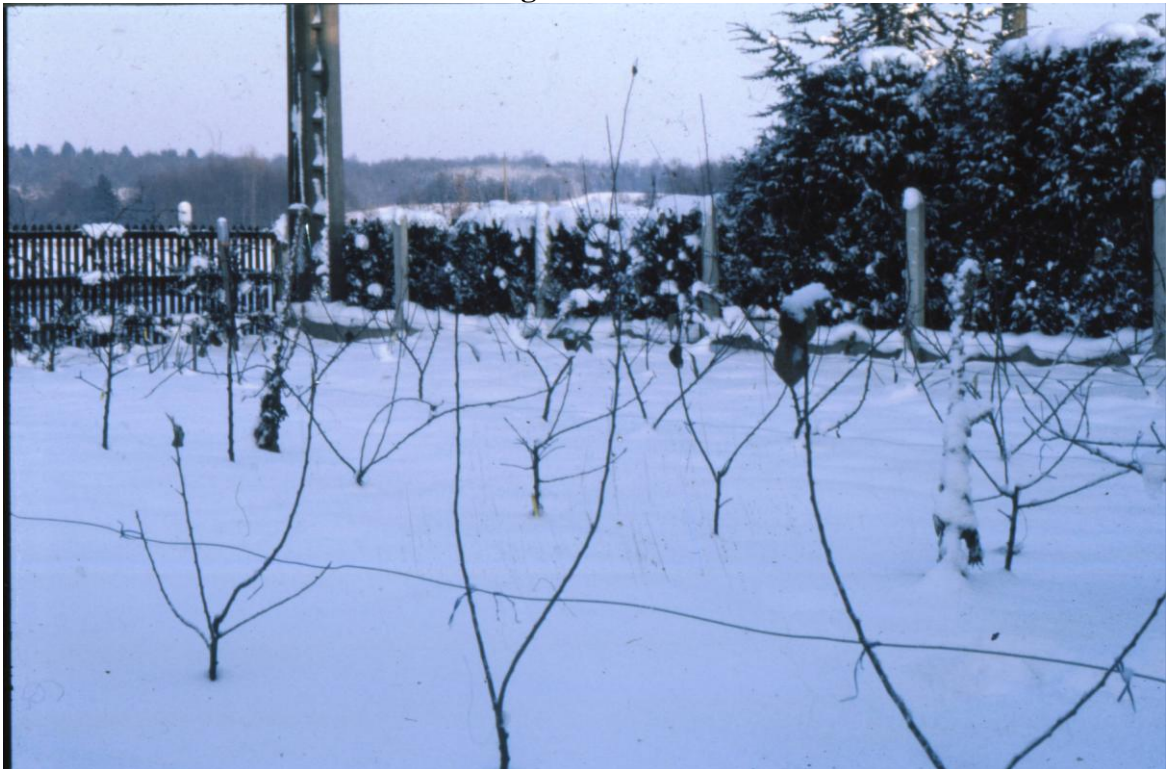
Ici mon verger de Fontenelle sous la neige

Fortes inondations dans mon mini verger conservatoire de Fontenelle.