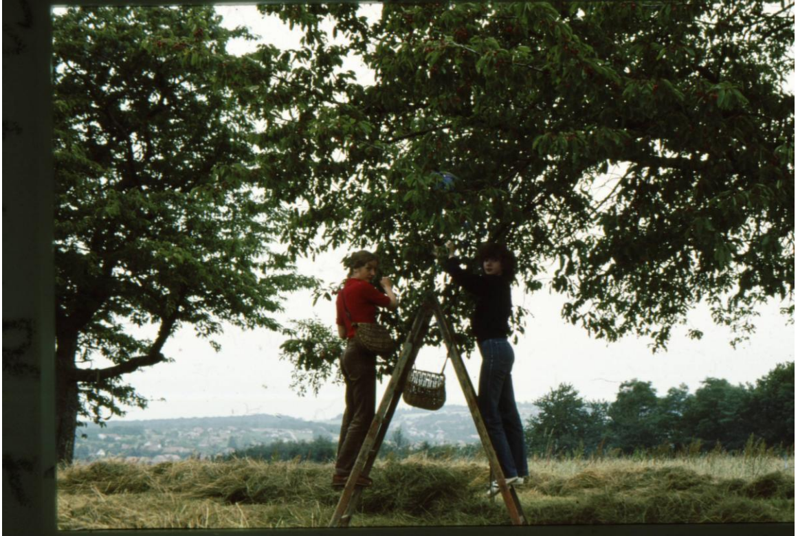
Vandoncourt cerises récoltée avec le panier côquin juillet 1980-nos filles

grande queue à résisté à l'éclatement par les nombreuses pluies de ces derniers temps.